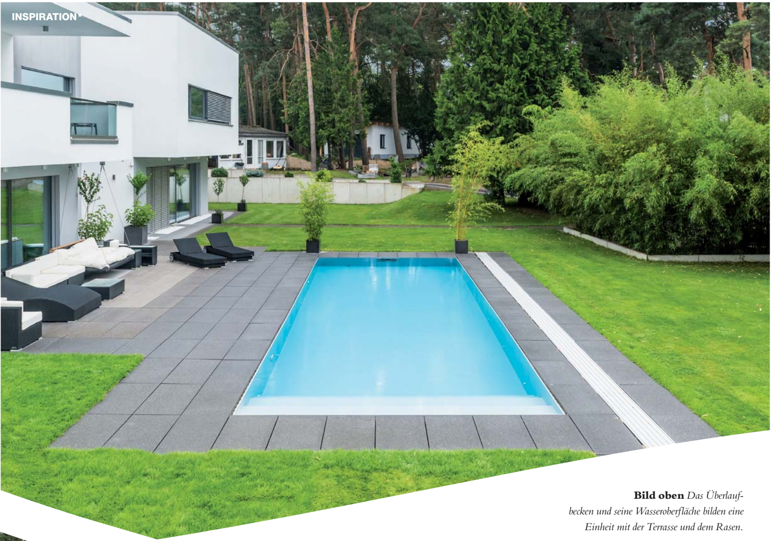
Bild oben Das Überlaufbecken und seine Wasseroberfläche bilden eine Einheit mit der Terrasse und dem Rasen.

Bild rechts Das kubische Haus weist eine gerade Formensprache auf, die das Becken harmonisch wieder aufgreift.