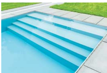
Bild unten Pflanzen komplettieren die Wohlfühlzone im Garten.